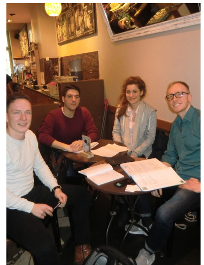
Mitglieder des Jungen Forums 2017

Das Junge Forum im BWK Berlin – Brandenburg wurde im Januar 2017 von Studierenden der Beuth Hochschule für Technik Berlin ins Leben gerufen und wollte Verknüpfungen zwischen Studierenden, Unternehmen und Studieneinrichtungen schaffen. Dazu gab es verschiedene Treffen, bei denen Defizite diskutiert und Ideenskizzen erarbeitet wurden. Zeitgleich wurde eine Zusammenarbeit mit dem Jungen Forum des Landesverbandes Nordrhein-Westfalen aufgenommen, das zahlenmäßig stark aufgestellt ist. Aktuell sind die Aktivitäten etwas zurückgefahren - Veränderungen in Studium und Beruf führten bei den Akteuren zu neuen Schwerpunkten.