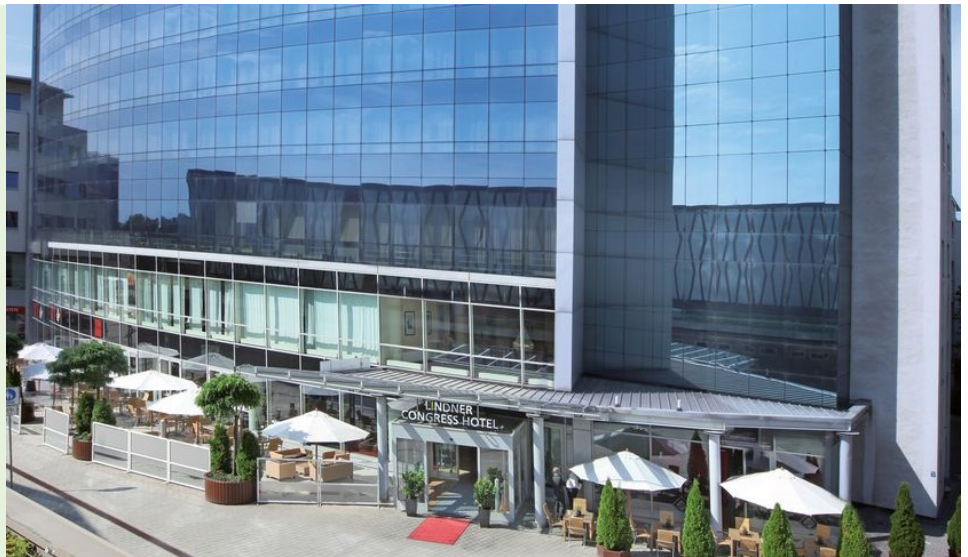
Lindner Congress Hotel Cottbus

Parkhaus mit 630 Stellplät- zen, Gebühr 7,50 € / Tag