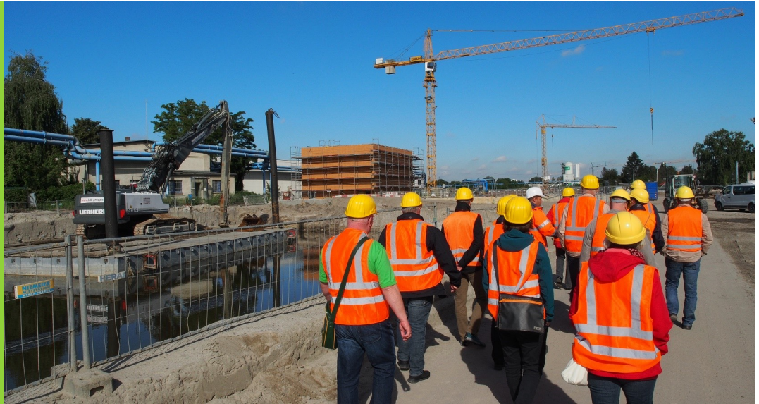
Baustellenexkursion A 100