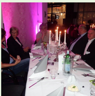
Abend im Hotel